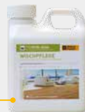
Weitzer Parkett ProVital Wischpflege