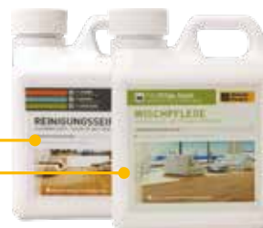
Weitzer Parkett Reinigungsseife